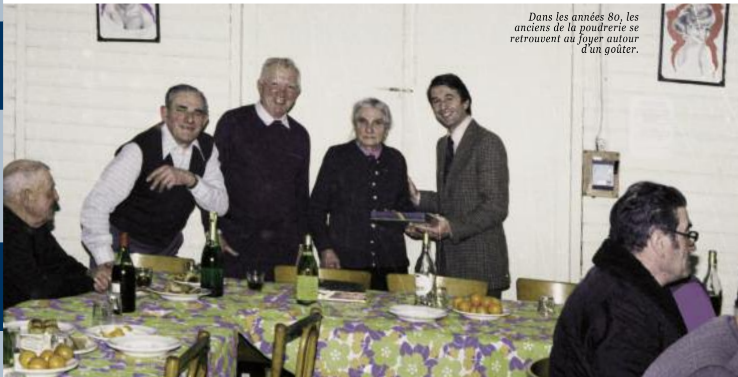
Dans les années 80, les anciens de la poudrerie se retrouvent au foyer autour d'un goûter.

D'après : L'article paru dans « l'Atout Parc N°42 de Janvier 2004 » rédigé par René Amiable et le témoignage audio, de Marius Bœuf.