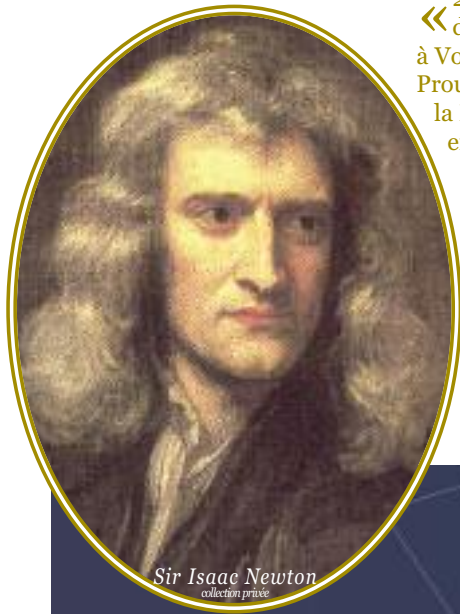
Sir Isaac Newton collection privée

C'est un groupement imaginaire d'étoiles voisines auquel les Anciens, souvent les grecs, ont donné un nom (pour les constellations de l'hémisphère nord, celles de l'hémisphère sud ont été nommées au 18è siècle).