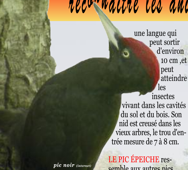
pic noir (internet)

une langue qui peut sortir d'environ 10 cm, et peut atteindre les insectes vivant dans les cavités du sol et du bois. Son nid est creusé dans les vieux arbres, le trou d'entrée mesure de 7 à 8 cm.