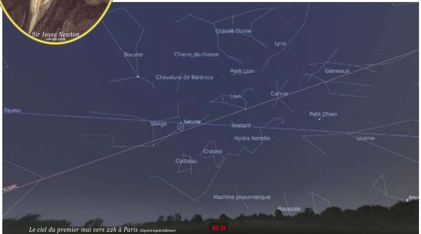
Le ciel du premier mai vers 22h à Paris (d'après le logiciel stellarium)