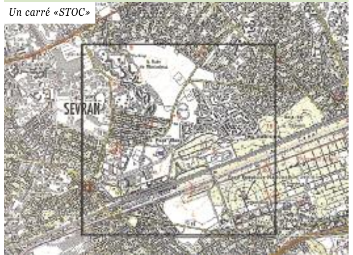
Un carré «STOC»

Chaque observateur prospecte un carré de 4 km 2 autour d'une commune de son choix. Il fixe 10 points d'écoute pour obtenir une représentation proportionnelle des différents habitats du carré. Il effectue 2 passages par an. Il doit dénombrer tous les oiseaux contactés durant 5 minutes sur chaque point pour obtenir un échantillonnage représentatif de l'avifaune du carré.