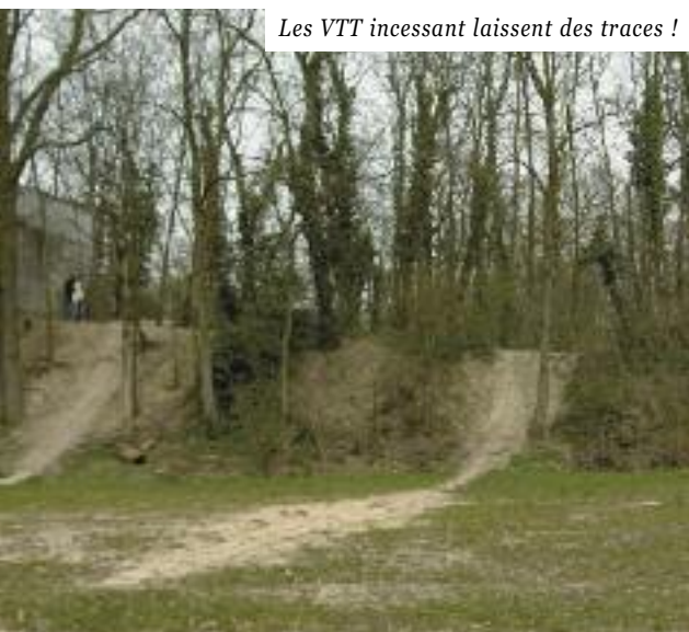
Les VTT incessant laissent des traces !

Une dizaine d'années plus tard, dans une étude réalisée pour le compte de l'Agence des Espaces Verts, le chiffre d'un million de visiteurs annuel était avancé. Mais au-delà de ces comptages qui montrent l'engouement du public pour le site, c'est sur le terrain que l'on peut mesurer les impacts de cette surfréquentation sur le milieu naturel : sous-bois piétinés, merlons érodés par les passages de VTT, ouvertures incessantes de nouveaux chemins.... Des actions ont été menées par les Amis du