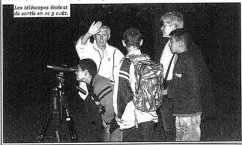
Les télescopes étaient de sortie en ce 5 août.

Nous avons eu la satisfaction de rencontrer un public curieux et intéressé, beaucoup de questions ont animé cette soirée riche en échanges. Le thème de cette 16ème Nuit des Etoiles était « la pollution lumineuse », dans nos villes tous les éclairages extérieurs participent à cette pollution qui nous empêche de voir le ciel nocturne dans toute sa splendeur. Nous n'étions pas épargnés par cette pollution même dans le Parc, mais nous ne manquons pas de renouveler cette manifestation à cet endroit qui était particulièrement bien adapté pour l'accès au public. Venez donc nous rejoindre l'année prochaine, même endroit même heure.