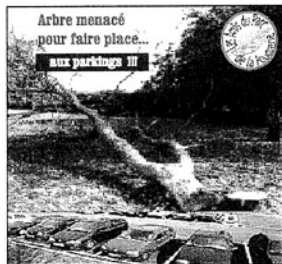
Affichettes posées sur la Tussion pour informer les riverains.

Inquiets des conséquences de la construction de ce bassin de rétention sur le site classé nous avons également adressé un courrier à Mme Nelly Olin, Ministre de l'Ecologie et du Développement Durable. Dans cette lettre, restée sans réponse, l'association demandait qu'une étude d'impact soit réa-