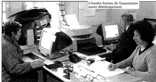
L'ancien bureau de l'association avant déménagement.

vous invitons à contacter le secrétariat : 01 48 60 28 58.