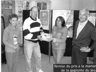
Remise du prix à la maman de la gagnante du jeu.

Les 18 et 19 septembre dans le cadre des Journées du Patrimoine nous souhaitons rencontrer les usagers du Parc et