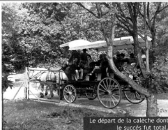
Le départ de la calèche dont le succès fut total.

Environ 150 bulletins réponses ont été retirés de l'urne. Le premier bulletin tiré au sort fut déclaré gagnant car il comportait les cinq bonnes réponses. C'est