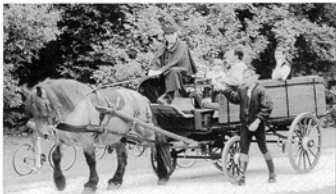
Balthazar dans l'une de ses nombreuses missions.