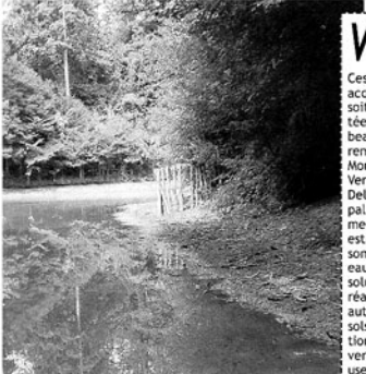
La mare à l'îlot presque à sec cet été !