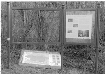
Les panneaux d'affichage régulièrement saccagés.