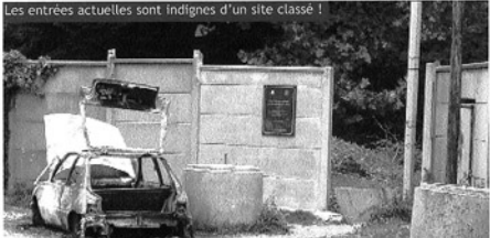
Les entrées actuelles sont indignes d'un site classé !