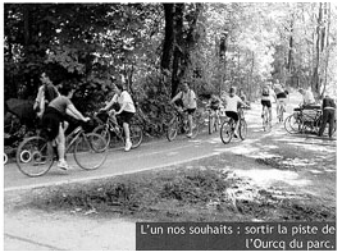
L'un nos souhaits : sortir la piste de l'Ourcq du parc.

Vigilance aussi dans la future construction de la déchetterie de Sevrain qui va être située à moins de 20 m du Parc. Citoyens, nous comprenons l'impérative nécessité d'une telle structure. Néanmoins, nous souhaitons avoir toutes les garanties de