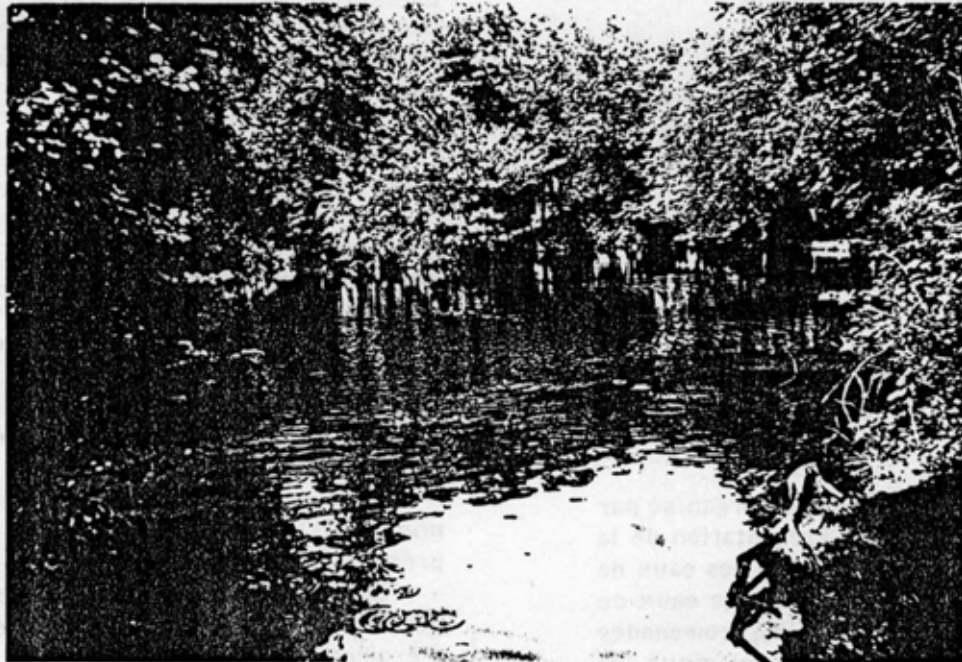
Les etangs et les marecages du Parc doivent être préservés.

Par le Service Animation du Parc, au Centre d'Accueil et au Forum : Journée Nationale de l'Environnement avec ENVIRONNEMENT 93.